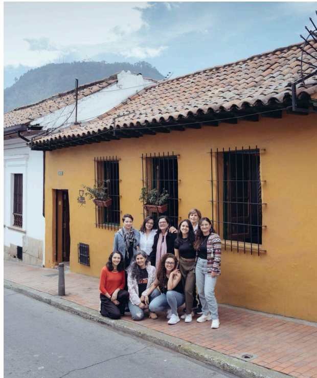
Mesa de Economía Feminista de Bogotá