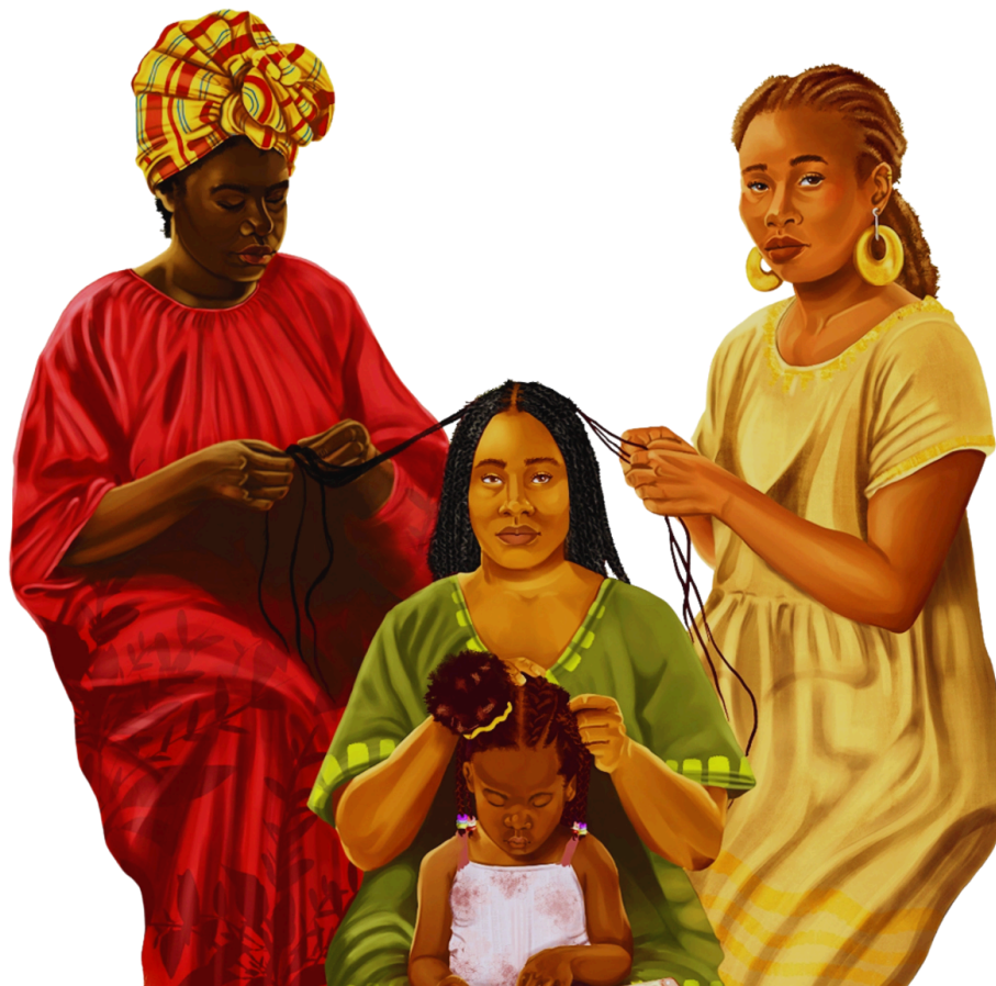
Arte: "MUJER" by Tatiana Olaya