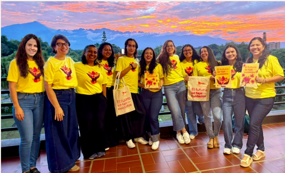
Observatorio para la Equidad de las Mujeres